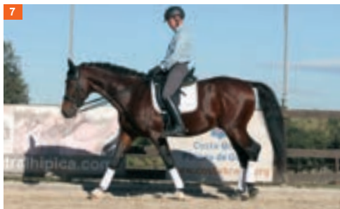
7 Séptima fase y cuarto tiempo: mientras el pie izquierdo sigue avanzando pisa con la mano derecha.