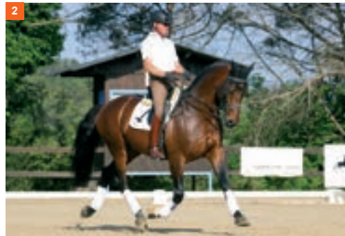
2 2º fase: momento de suspensión con las cuatro extremidades en el aire.