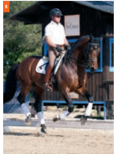
6ª fase: levanta la mano interior y queda en el aire, produciéndose el momento de suspensión.