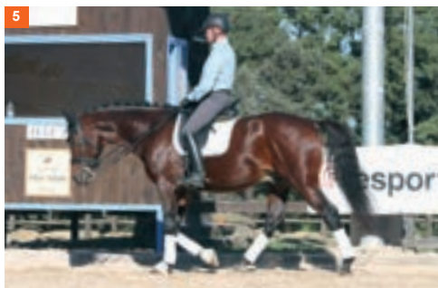
5 Quinta fase y tercer tiempo: mientras la mano derecha sigue avanzando pisa el pie derecho.