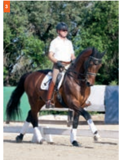
3ª fase: Levanta el pie exterior.