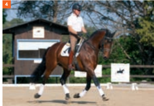
4 4º fase: momento de suspensión con las cuatro extremidades en el aire