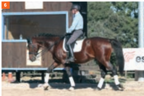
6 Sexta fase: mientras la mano derecha sigue avanzando levanta el pie izquierdo.