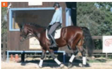
8 Octava fase: mientras el pie izquierdo sigue avanzando levanta la mano izquierda. La siguiente foto volvería a ser la número 1.