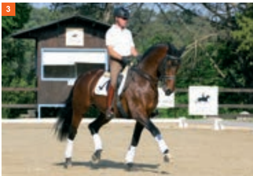
3 3º fase y 2º tiempo: apoya y se impulsa sobre el bípodo diagonal izquierdo