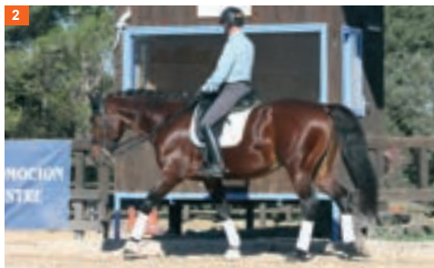
2 Segunda fase: mientras avanza la mano izquierda levanta el pie derecho.