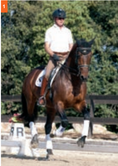
1ª fase: pisa con el pie exterior que en este caso es el posterior izquierdo. Es el primer tiempo de galope.