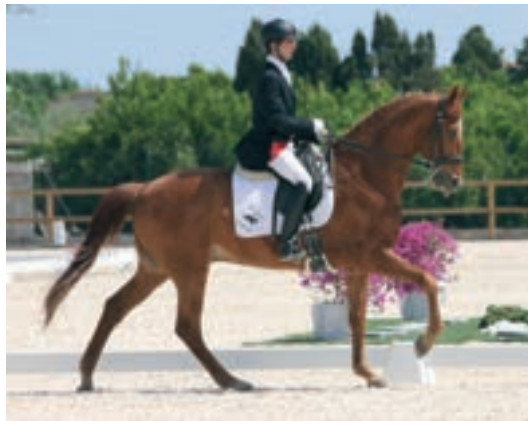
El galope es un aire natural asimétrico y basculado en tres tiempos.

Cuando decimos que galopa "al revés", significa que lleva la distribución contraria al sentido de giro. Es decir que yendo a mano derecha adelanta más sus extremidades izquierdas. También galopar en trocado es galopar "al revés". Pero aquí la diferencia está en que contamos con que el caballo lo realiza por voluntad del jinete.