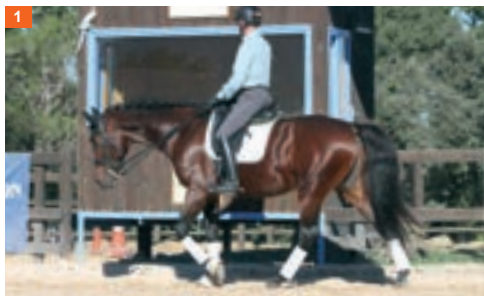
1 Primera fase y primer tiempo: el caballo pisa con el pie izquierdo y levanta la mano izquierda.