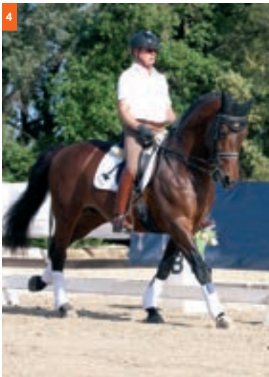
4ª fase: Manteniendo el diagonal exterior pisa la mano interior. Es el 3er tiempo.