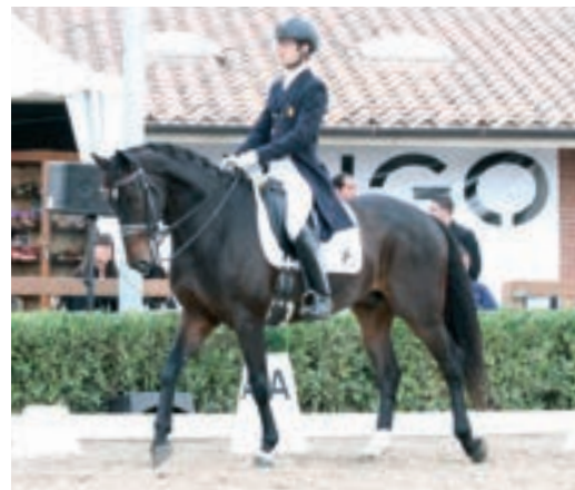
Caballo de 7 años al paso medio.

PASO LIBRE: Es un aire de descanso en el que se da al caballo entera libertad para extender su cuello y bajar la cabeza.