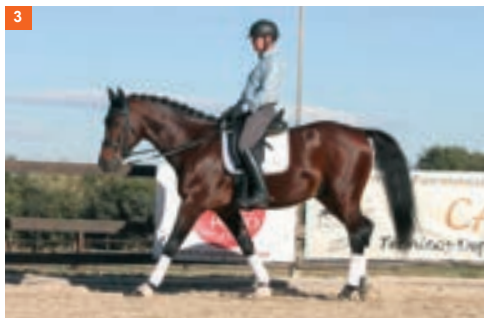
3 Tercera fase y segundo tiempo: mientras avanza el pie derecho pisa la mano izquierda.