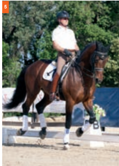
5ª fase: Manteniendo la mano interior levanta el diagonal exterior.