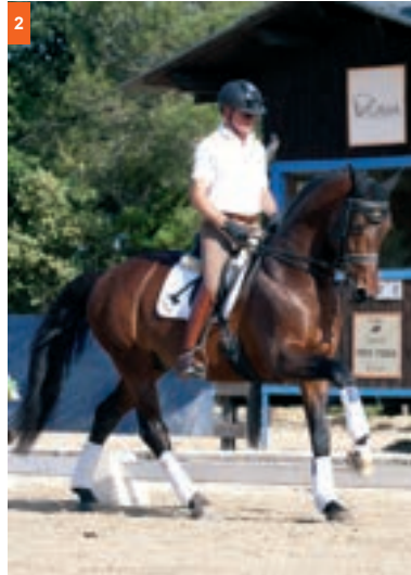
2ª fase: manteniendo el pie exterior en el suelo pisa el diagonal exterior (pie interior-mano exterior) Se produce el 2º tiempo.