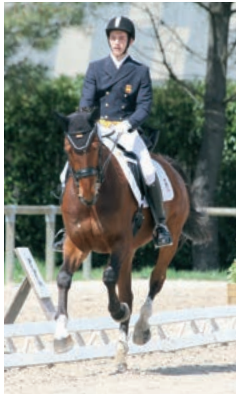
Galope largo, primer tiempo.

GALOPE LARGO: "(...) El caballo cubre el máximo de terreno, conservando el mismo ritmo, alarga sus trancos al máximo(...) El jinete permite a su caballo (...) que descienda la cabeza y alargue el cuello (...)."