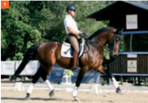
1 1º fase y 1º tiempo: apoya y se impulsa sobre el bípodo diagonal derecho