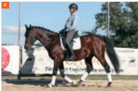
4 Cuarta fase: el pie derecho sigue avanzando y levanta la mano derecha.